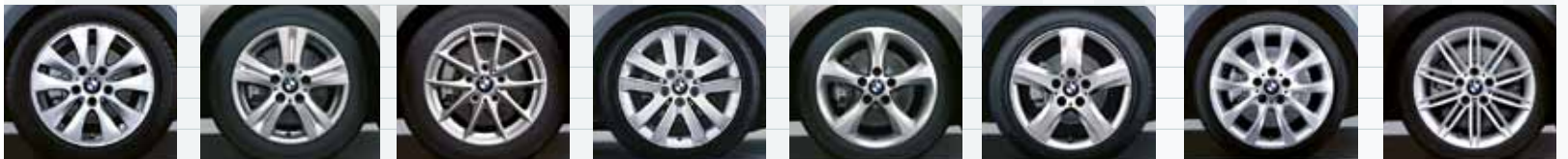
2KH (styling 229) 2BT (styling 222) 2K9 (styling 360) 2KC (styling 141) 2R2 (styling 256) 2CH (styling 142) 2KF (styling 217) 2MG (styling 207M)