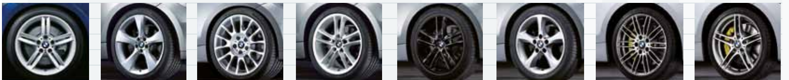
2MH (styling 208M) SZ (styling 311) SZ (styling 216) SZ (styling 182) SZ (st. 182 zwart) SZ (styling 256) SZ (styling 269) SZ (styling 313)