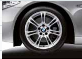
2NC (styling 350M)