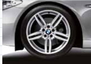
2ND (styling 351M)