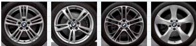
2MS (styling 368 M) 2NE (styling 369 M) SZ (styling 310 M) SZ (styling 311)