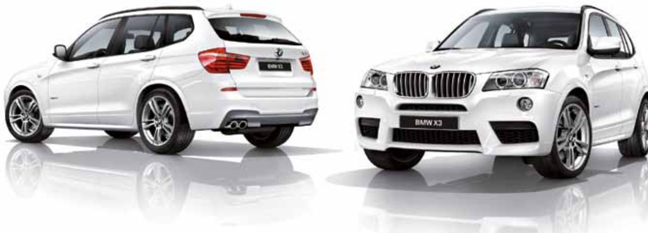
X3 met M sportpakket, hier afgebeeld met M wielen Dubbelspaak (styling 369 M)