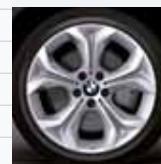
330 (styling 335)