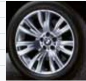
337 (styling 223M)