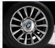
2MW (styling 265 I)