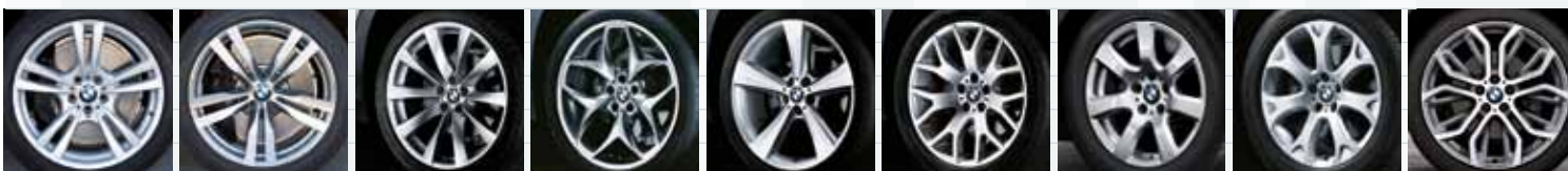
2NT (styling 299M) 2NU (styling 300M) SZ (styling 239) SZ (styling 215) SZ (styling 128) SZ (styling 177) SZ (styling 233) SZ (styling 211) SZ (styling 375)